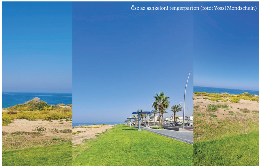
Ősz az ashkeloni tengerparton

A téli időszakban két ünnep van a zsidó naptárban, hanuka és tu bisvát, a fák ünnepe. Az egyik decemberre, a másik februárra esik. Bízunk benne, hogy a jeles napokon jó idő lesz, főleg az utóbbit a természetben tudjuk tartani, ideálisak a körülmények a faültetésre. A hanuka inkább családi ünnep, a nyolcnapos iskolai szünet miatt sokan indulnak kirándulni. A hanuka ünnepe visszavisz minket a Makkabeusok görögök felett aratott heroikus győzelméhez. Időszámításunk előtt, a második században a görög Antiokhosz bálványokat vitt a Szentélybe, arra kényszerítette a zsidókat, hogy boruljanak le ezek előtt.